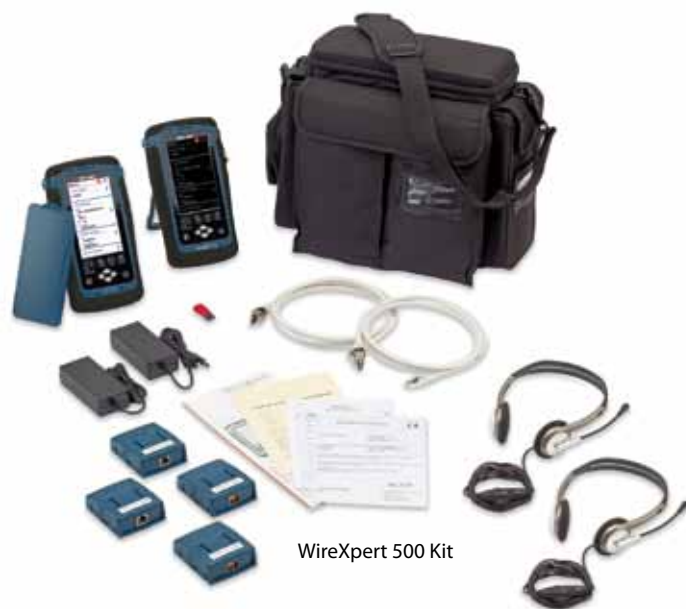
WireXpert 500 Kit